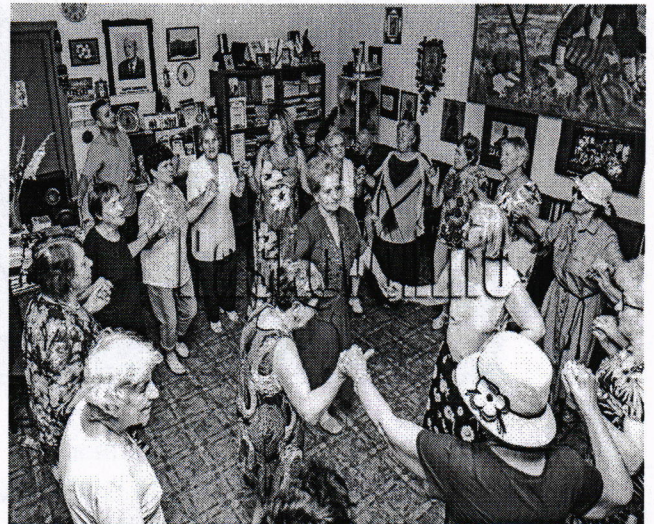
Певческите тракийски групи „Тракийска дъга”- Хасково и „Иглика”- Маджарово обмениха опит.